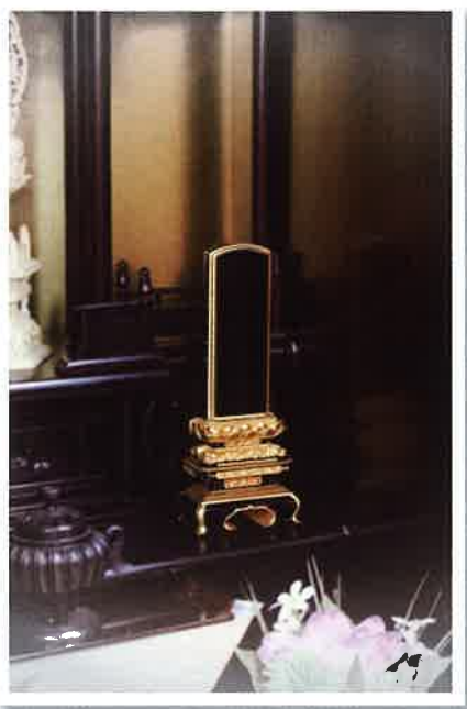
no. 02 やよい